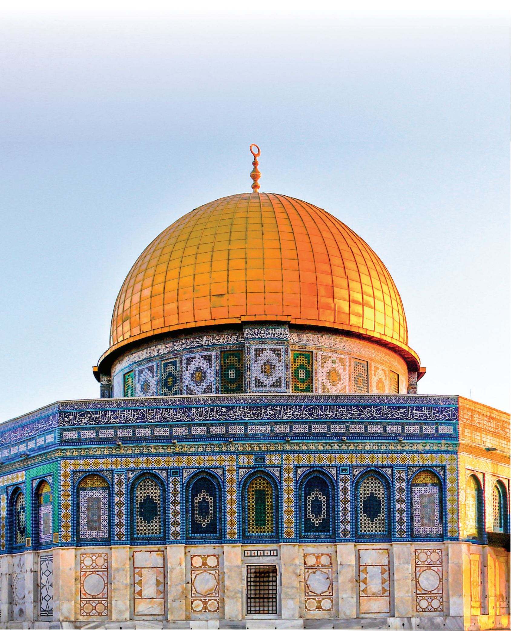
KUDÜS MEKTEBİ PROJESİ 'Gençlik Projeleri Destek Programı 2018/1 kapsamında Gençlik ve Spor Bakanlığı Tarafından Desteklenmektedir'