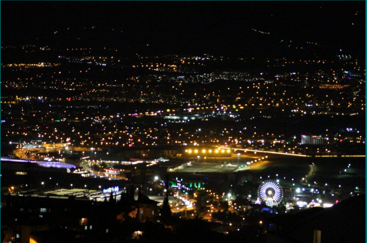
Okul pansiyonundan bir İzmit akşamı