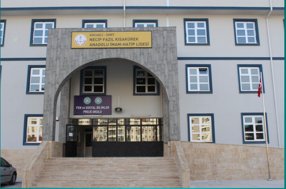
Okulumuzun dışardan görünümü