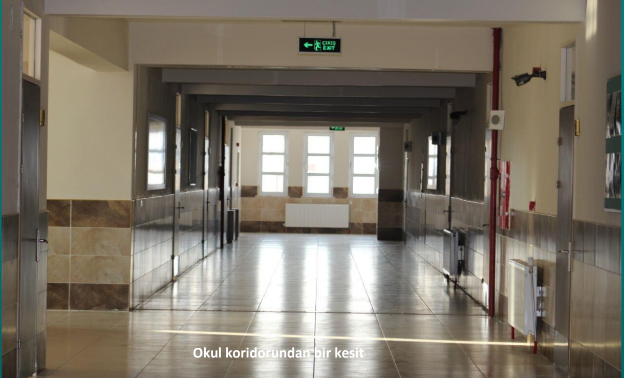
Okul koridorundan bir kesit